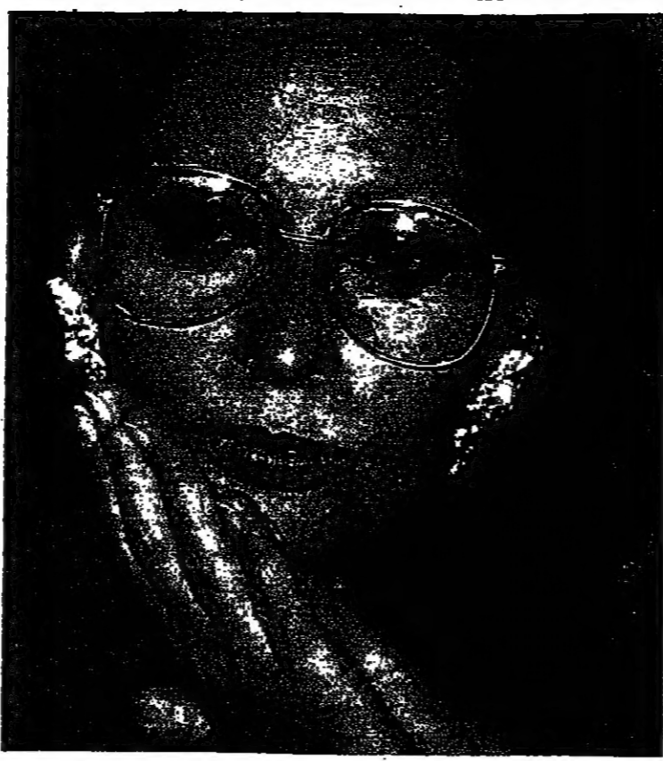
توجيه لمارلين، لانه تستطيعين ان تكوني ما تريدين. ثم تحدث عن موهباته: «ان الشهرة في الانسان هي التي تخلف الأشياء مشهورة. ولكن اذا لم تعد، انا والعالم، متفقين على العالم ان يتغير.»

كانت مارلين ذات موهبة كبيرة كعملية. بالإضافة الى قدرتها على الإلقاء، ليس هنالك خرج يستطيع ان يعلم مظهر كيف تقوي، وتصنع رمزا جنسيا. أكبر مثال